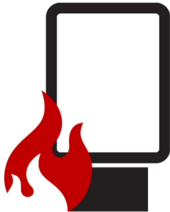
Feuer von außen